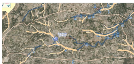
Visor GVA, cartografía PATRICOVA y DANA.

Por tanto, la actuación se encuentra en la situación especificada en el apartado 3 de la disposición transitoria segunda de la Ley 2/2025, de 15 de abril, de la Generalitat; y, por ello, procede continuar con su tramitación ordinaria, y puede ser aprobada conforme a la normativa urbanística vigente. En concreto, esta disposición establece que: “Estos instrumentos deberán cumplir con las limitaciones derivadas del PATRICOVA y del Reglamento del dominio público hidráulico, o norma que lo sustituya. En el informe del órgano autonómico competente en evaluar el riesgo de inundación que valore las limitaciones derivadas del PATRICOVA y del Reglamento del dominio público hidráulico, además, deberá incluirse un apartado sobre los estudios necesarios para evaluar el