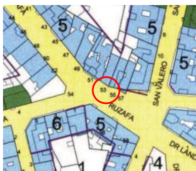
PLAN ESPECIAL DE PROTECCIÓN DEL ENSANCHE RUSSAFA SUD- GRAN VIA P.E.P.2

El elemento objeto de protección se encuentra en el inmueble situado en la parcela catastral 6117217Y12761G. Según el planeamiento vigente, el Plan Especial del Ensanche de Ruzafa-Sur Gran Vía (PEP-2), está clasificado como Suelo Urbano, con calificación de Ensanche (ENS-2).