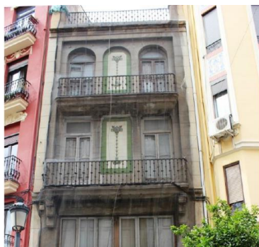
FACHADA C/ RUSSAFA, 53 (VALÈNCIA)

Se trata de dos paneles cerámicos que se sitúan en el centro de la fachada principal a la altura de la primera y segunda planta del inmueble, construido en el año 1913.