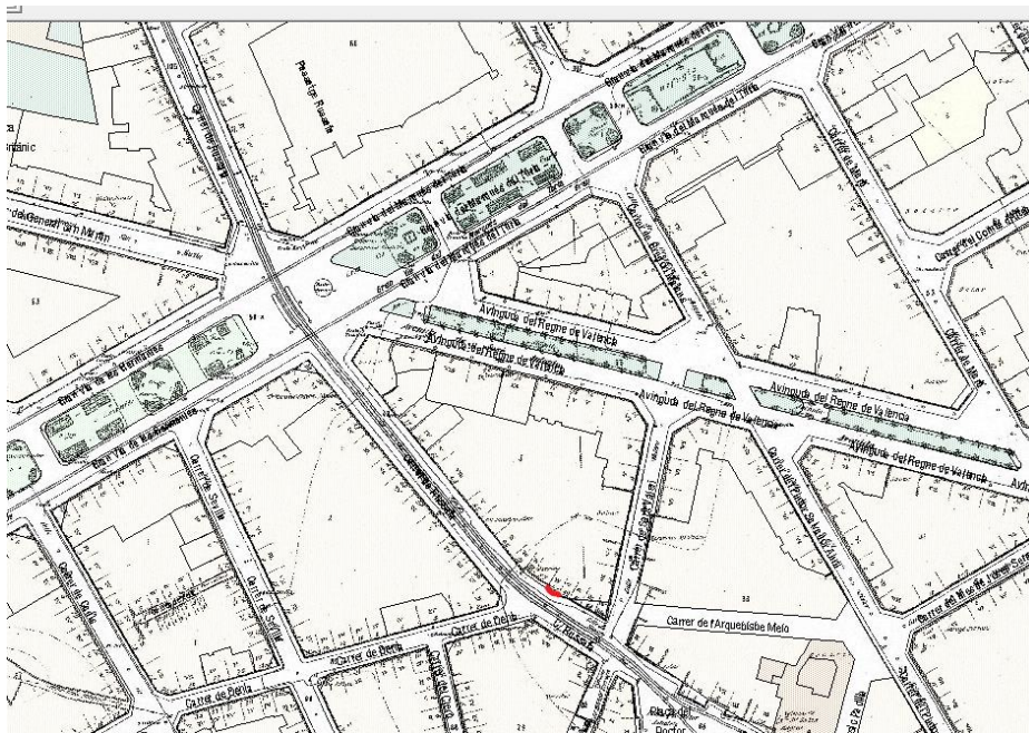
Cartográfico Municipal 1929-1945

Los motivos florales en ambos paneles son idénticos, con la diferencia de la forma de la hornacina que en un panel el lado superior es recto achaflanado en sus dos esquinas superiores y en el otro panel es un arco de media punta. El motivo floral representa una planta alargada con formas geométricas, con un tallo recto leñoso en el centro, base y, coronación con hojas y flores fantásticas. La policromía de los paneles es verde para tallo, base y hojas y recercado, blanco para el fondo y granate y azul para las flores (ver fotos). Los paneles tienen una forma rectangular vertical, cuyas dimensiones son 1,05 x 2,25; tienen un total de 119 piezas cada uno (15 en el lado vertical y 7 piezas en el horizontal) las dimensiones de cada pieza individualizada es 0,15 x 0,15 m.