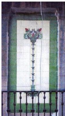
HORNACINAS PANELES CERÁMICOS