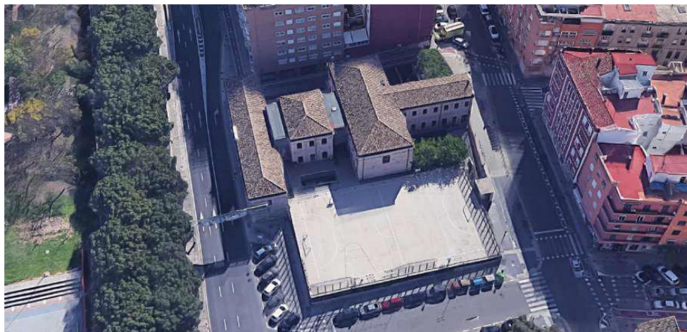
Figura 1. Estado actual

Según el vigente Plan General de Ordenación Urbana de València (PGOU), la parcela está clasificada como suelo urbano, está incluida en la zona de calificación Ensanche (ENS-1) y está calificada como Sistema Local Educativo Cultural (EC). Asimismo, se encuentra incluida en el Catálogo de Edificios, Conjuntos y Elementos de Interés Arquitectónico del Municipio de València, que forma parte del PGOU, con la clave 086 y está protegida con nivel 2. De acuerdo con ello, actualmente el edificio cuenta con una protección básica estructural y una protección subsidiaria parcial.