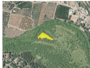
Suelo forestal (PATFOR)