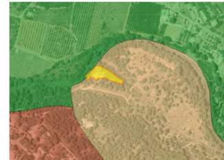
Área de Regeneración (PORN S. Calderona)

Por tanto, el Plan Especial propone para la adecuación urbanística de la EDAR su calificación como equipamiento de infraestructura formando parte de la red primaria (PQI), manteniendo la clasificación como suelo no urbanizable común, cumpliendo las condiciones impuestas por normativas sectoriales.